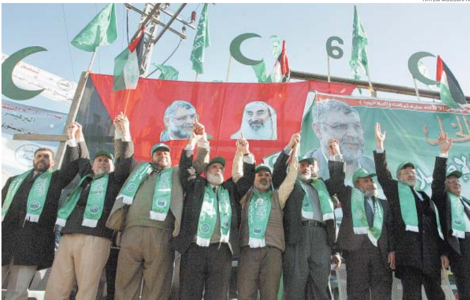
MUDANÇA - Candidatos do Hamas fazem campanha na Cidade de Gaza; grupo palestino deixa de pregar publicamente a destruição de Israel